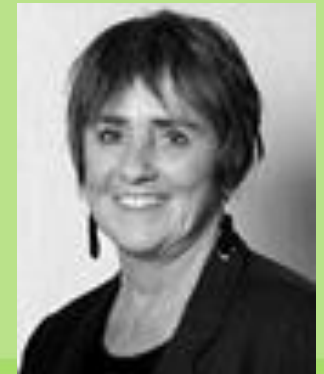
Tiffany Field, Ph.D.

Több, mint 100 publikált kutatás 2001 és 2011 között az érintés-terápiák hatásáról